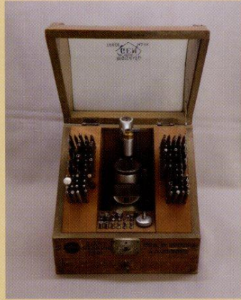
たがね(宝石メガネ時計すずき蔵)