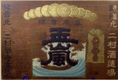
特約店看板(二村酒造場)