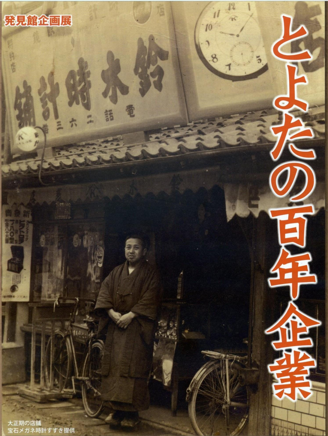
大正期の店舗 宝石メガネ時計すずぎ提供